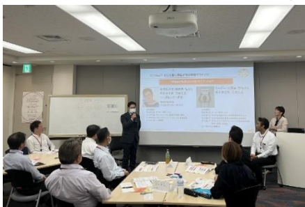
イクボスセミナーの様子

4）男性育休取得推進をテーマとした講義（講師 ベネッセシニアサポート株式会社 / NPO 法人 ArrowArrow）